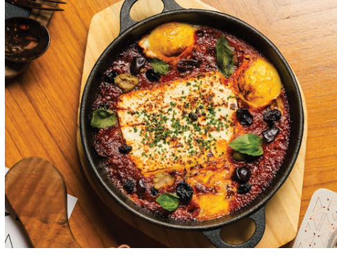
Wood Fire Baked Feta Pot