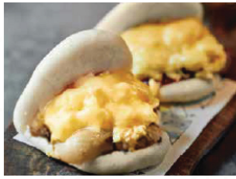
Egg and cheese bao