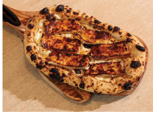
Baked Halloumi Flatbread