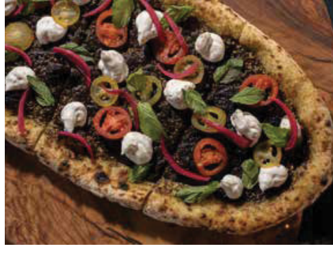
Zaatar Manaeesh Flatbread