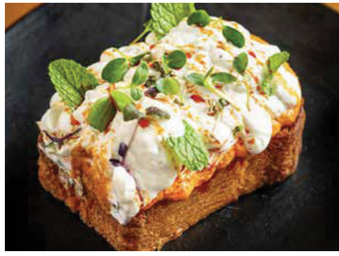
Turkish Eggs On Brioche