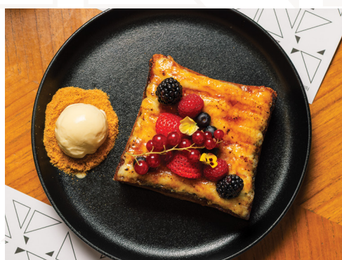
Catalan French Toast