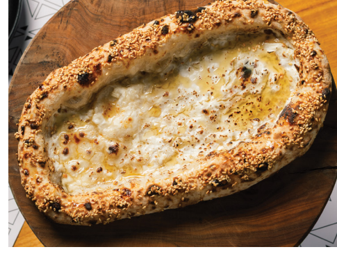
Feta Cheese & Honey Flatbread