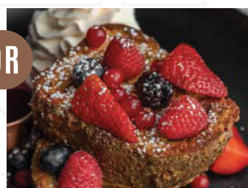
Nutella French Toast